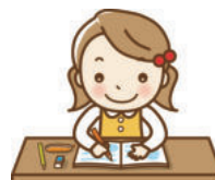
お子さまの習いごとに