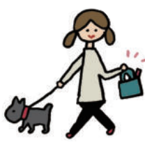
外出先での服薬に